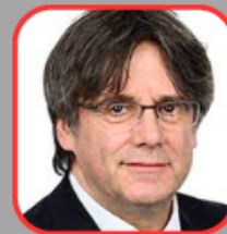
CARLES PUIGDEMONT CASAMAJÓ