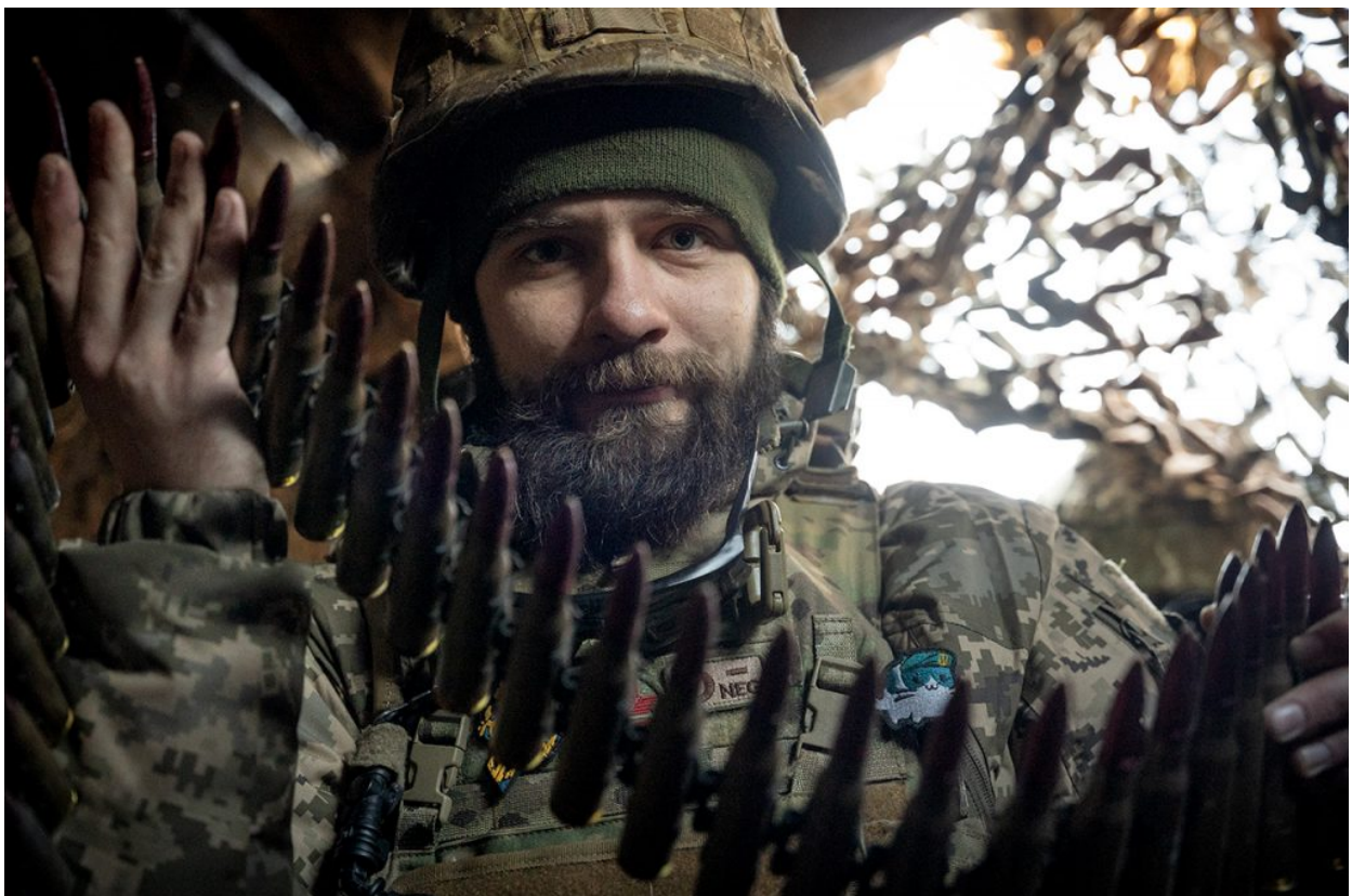
Un soldat de les Forces Armades d'Ucraïna sostenint bales