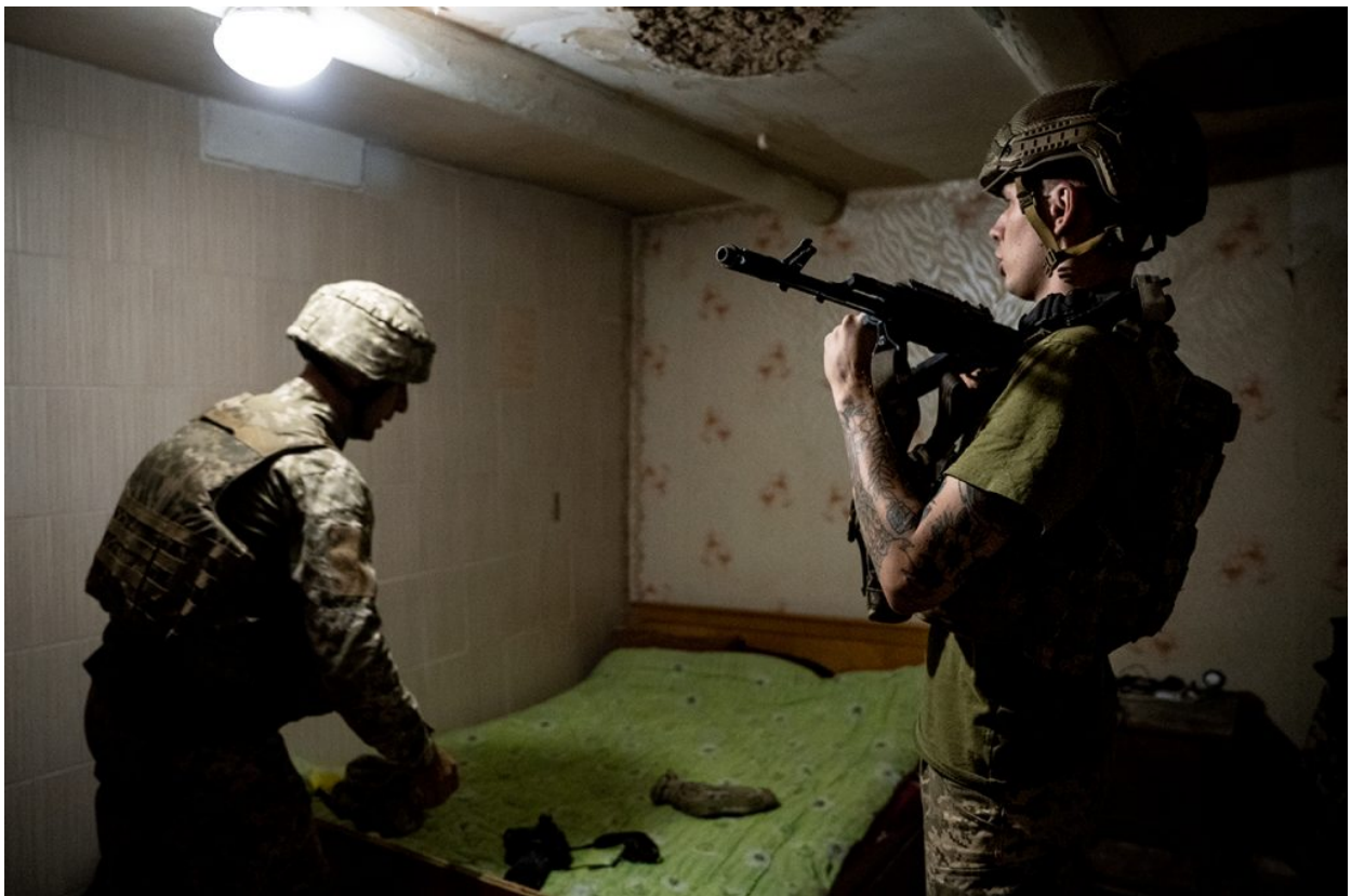
Dos soldats de l'exèrcit ucraïnès es preparen per anar a una posició de tir a primera línia del front als afores de