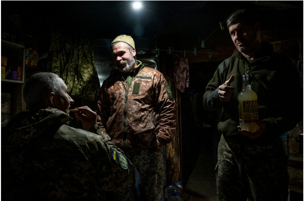
Soldats ucraïnesos a la cuina de les trinxeres de la rodalia de Verkhnetoretske, 11 de novembre de 2021.