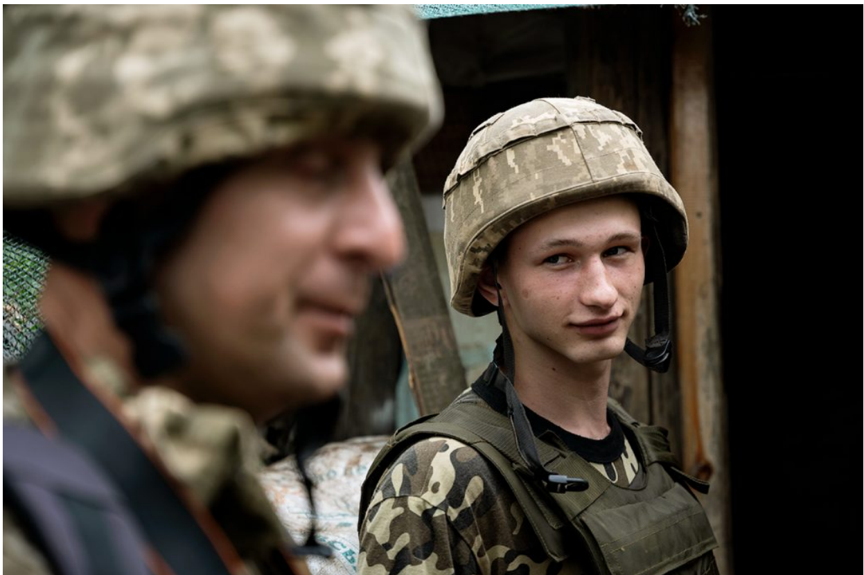
Dos soldats de les Forces Armades d'Ucraïna a posicions de combat a la zona de Krasnohorivka, 22 de juliol de 2021.

trinxeres serpentejants, reforçades amb fustes, i amb algunes parts que són túnels. A les trinxeres hi ha de tot per viure dignament, si bé de forma rudimentària: dormitori, cuina, bany, menjador, safareig i posicions de tir. Quan no hi ha trets, les hores passen lentament, però sempre hi ha algun moment del dia en què hi ha foc creuat. Normalment, quan comencen els trets, els soldats (els que no són a primeríssima línia, a posicions de tir) no fan gaires escarafalls: si al front hi ha desenes de milers de soldats, i tenint en compte que uns i altres saben on són les posicions enemigues, si cada setmana només en maten un o dos o cap, la conclusió immediata és que sovint no disparen a matar. I quan acaben les ràfegues i els esclats, tot continua igual, enmig del tedi més absolut i la incertesa i l'amenaça d'una potencial escalada futura.