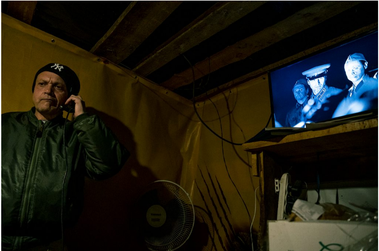
Un soldat de les Forces Armades d'Ucraïna comunicant-se amb soldats a les trinxeres, des d'un menjador a primera línia a prop de Chermalyk, 15 de novembre de 2021.