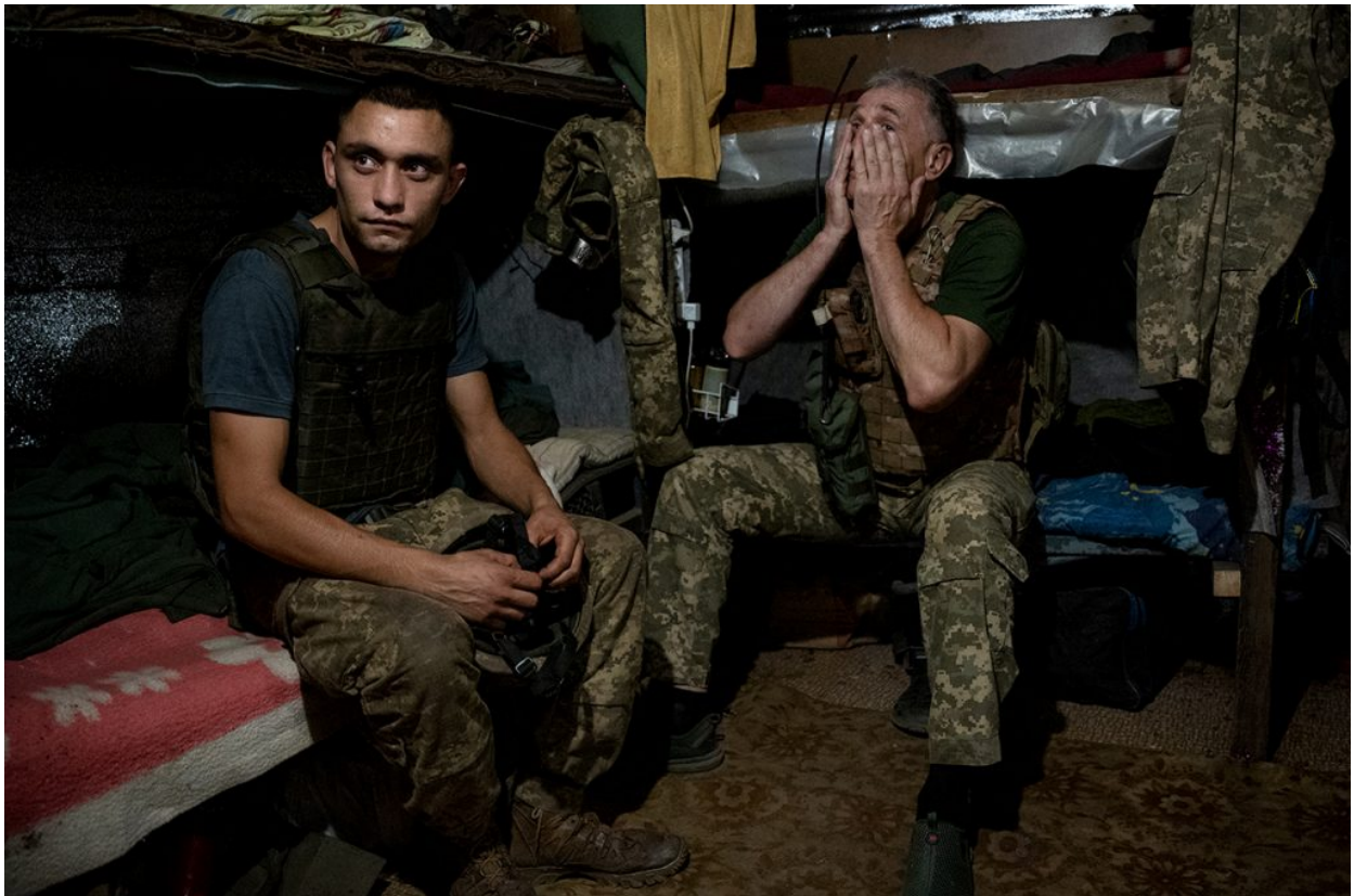
Dos soldats de les Forces Armades d'Ucraïna a un dormitori a les trinxeres de Krasnohorivka, 22 de juliol de 2021.