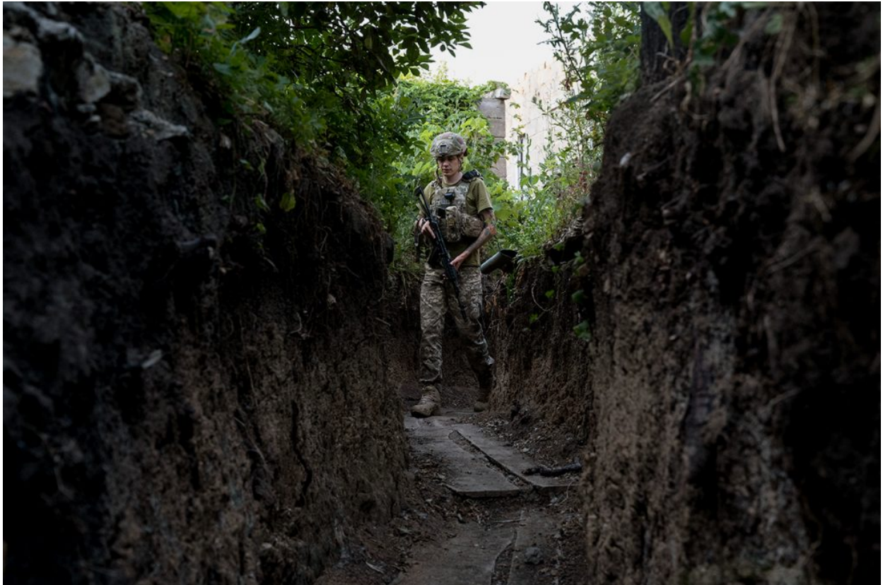
Un soldat de l'exèrcit d'Ucraïna a una trinxera prop de Marinka, 24 de juliol de 2021.