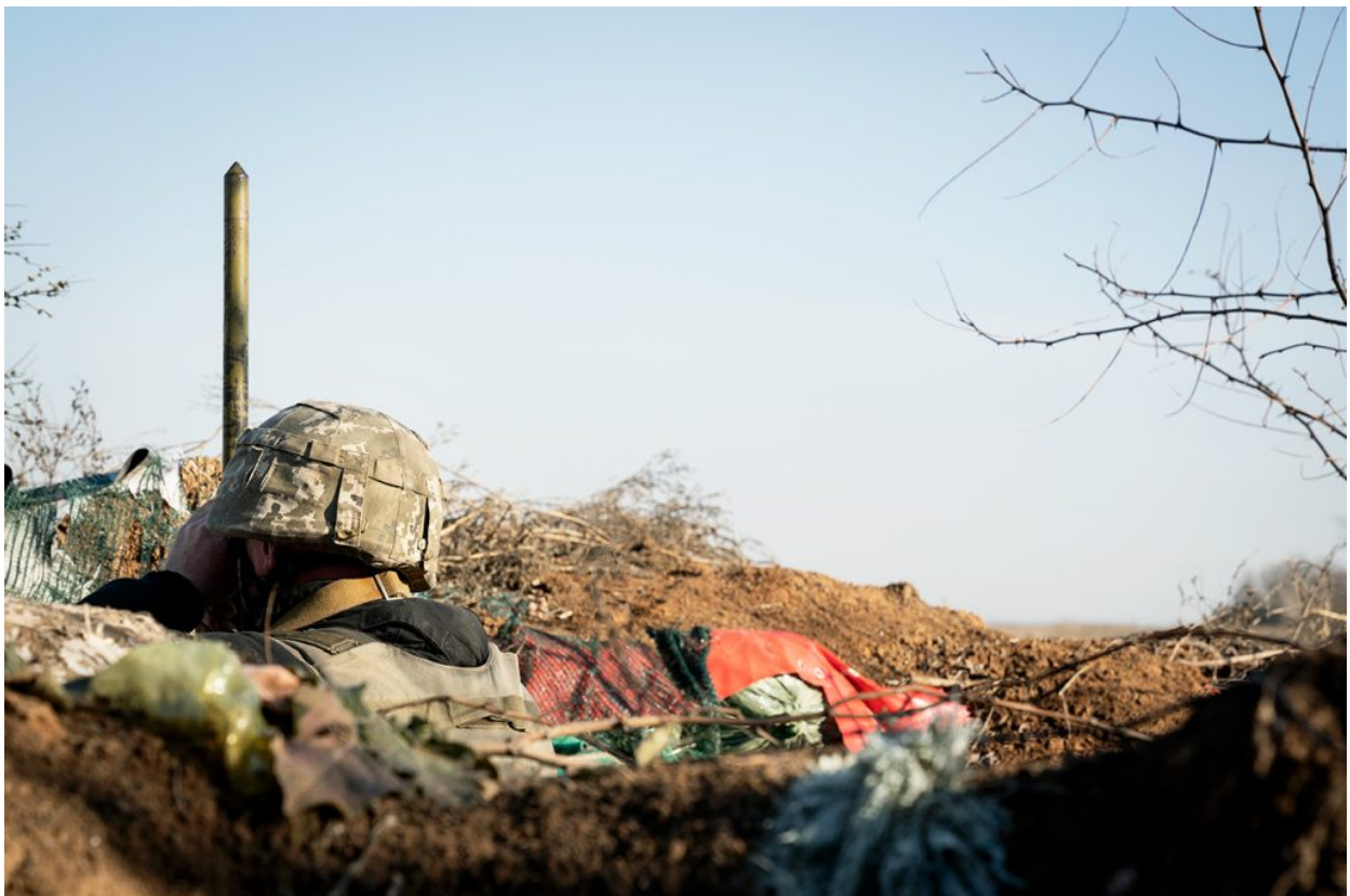
Un soldat de les Forces Armades d'Ucraïna observant pel periscopi les posicions dels rebels pro-russos, a les