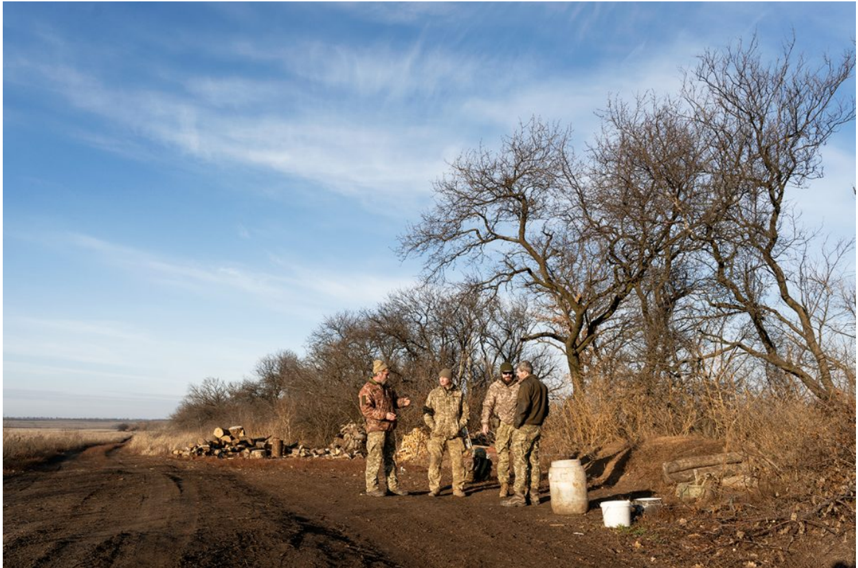
Soldats ucraïnesos a un camí als afores de Verhketoretske, darrere de les trinxeres, 11 de novembre de 2021.