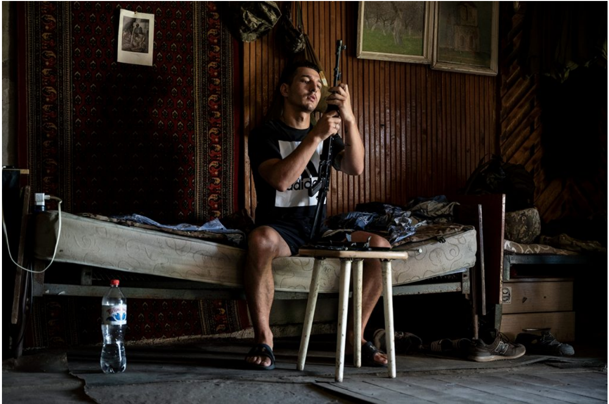
Un soldat ucraïnès posant a punt el seu kalashnikov a una posició de combat a Marinka, 19 de juliol de 2021.