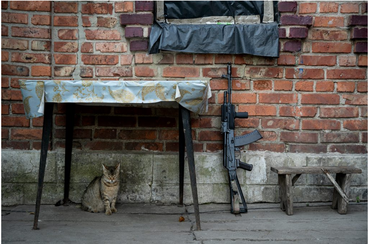
Porxo d'una casa abandonada als afores de Marinka, on s'allotgen soldats ucraïnesos desplegats al front, 24 de juliol de 2021.