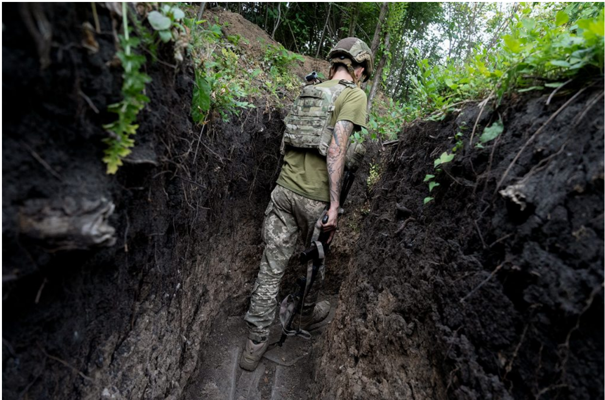
Un soldat de l'exèrcit d'Ucraïna a una trinxera prop de