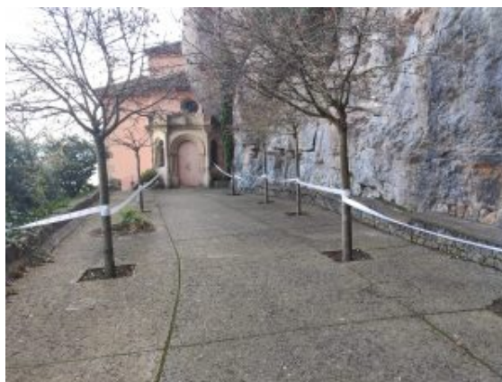
Camí de la capella de la cova

Tota aquesta gent que ha perdut la feina o està perdent el negoci, no tenen ni tan sols el consol de poder-se queixar o manifestar per reclamar millores. Si algú s'atreveix a denunciar que les restriccions li han fet perdre la feina i els ingressos per viure, immediatament serà tractat de mala persona perquè no pensa en els milers de morts que hi ha degut a una malaltia que han anomenat covid-19. La por escampada per un virus, suposadament mortal, ha creat una situació d'indefensió extrema per a una part dels ciutadans. Hi ha moltes persones a Catalunya que encara conserven la feina, però de mica en mica seran més les persones acomiadades o amb negocis arruïnats. Aquesta vegada, però, ningú sortirà al carrer a manifestar-se per fer que les coses canviïn, ara tot gira al voltant d'un virus que, diuen, provoca molts morts.