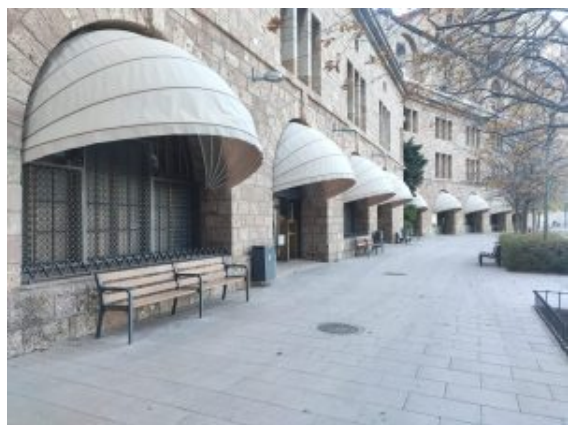
Un dels restaurants i botiga, tancat i barrat

Quan camines per Barcelona i l'Àrea Metropolitana, no ets gaire conscient de la quantitat de negocis que han estat afectats. Sols si vas per zones turístiques pots veure molts comerços que han tancat portes, però a la resta dels barris, la majoria estan oberts perquè mantenen la clientela habitual, la del barri.