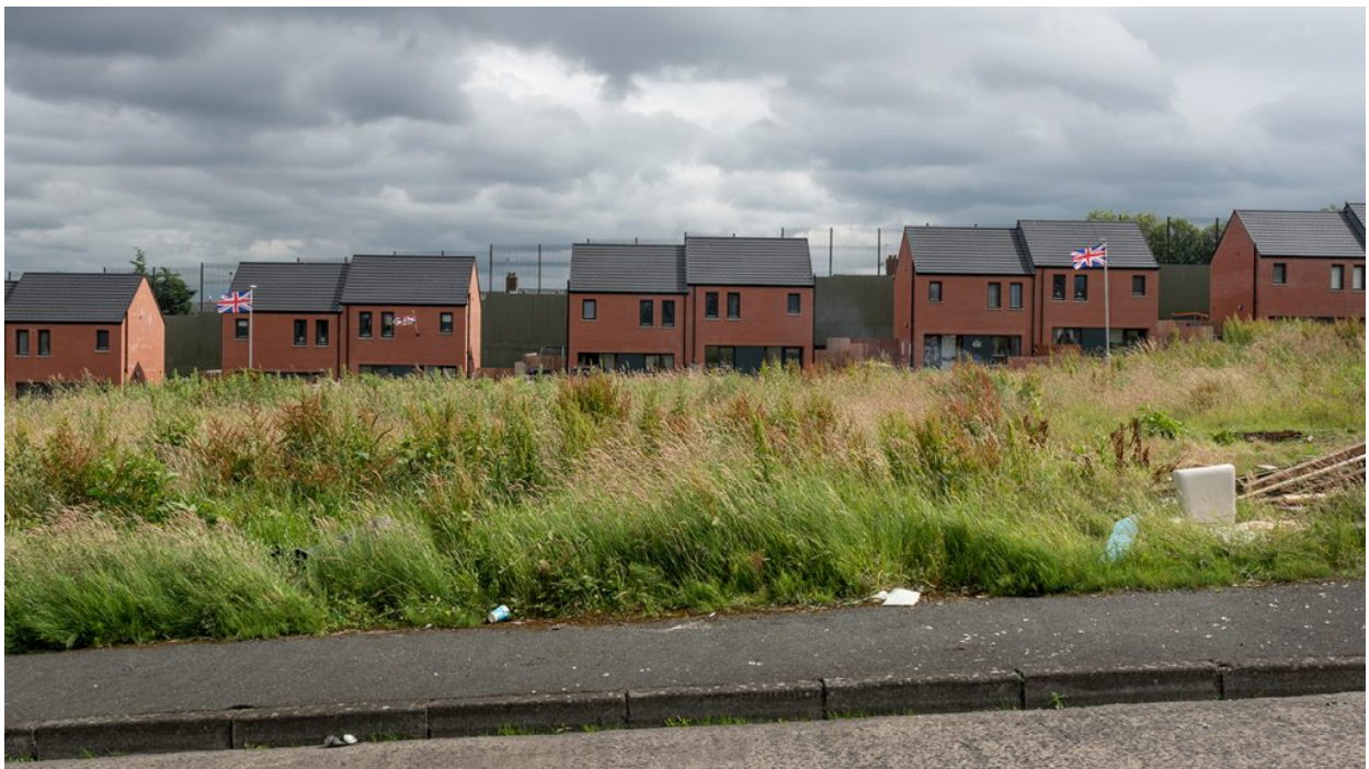
La tanca separa la zona unionista de Glenbrynn i la zona nacionalista d'Alliance Av.