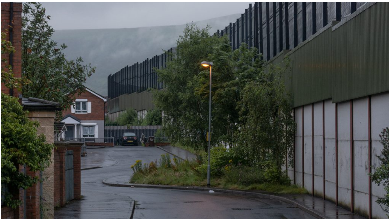
Cantó sud del mur de Cupar Way, al barri nacionalista de Falls Rd.