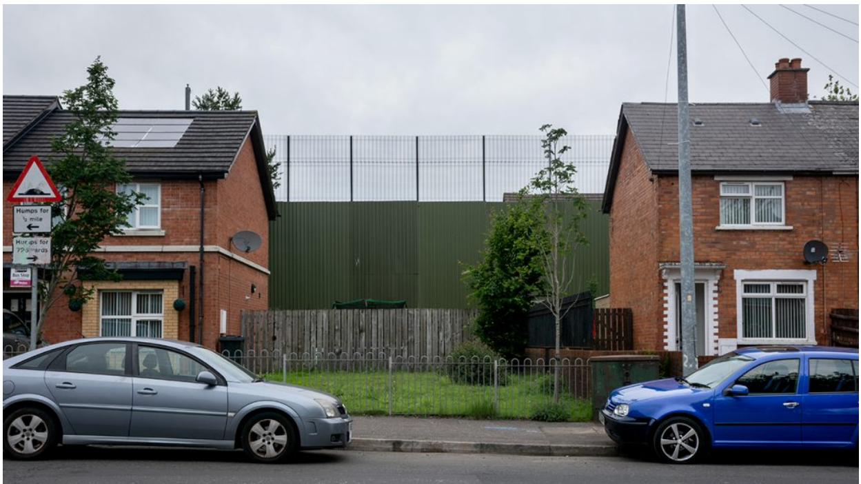
Alliance Av, a l'extrem nord del bastió del nacionalisme més radical d'Ardoyne.