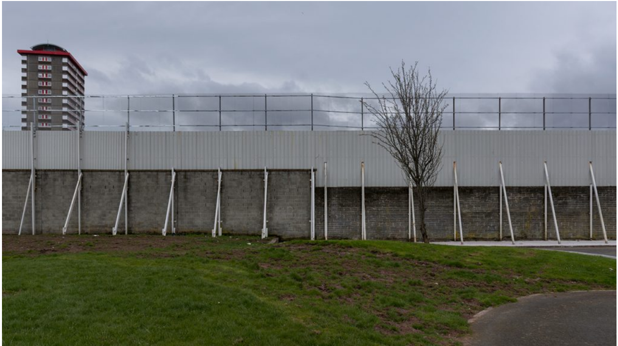
Mur a Beverly Street, al bastió unionista de Shankill.