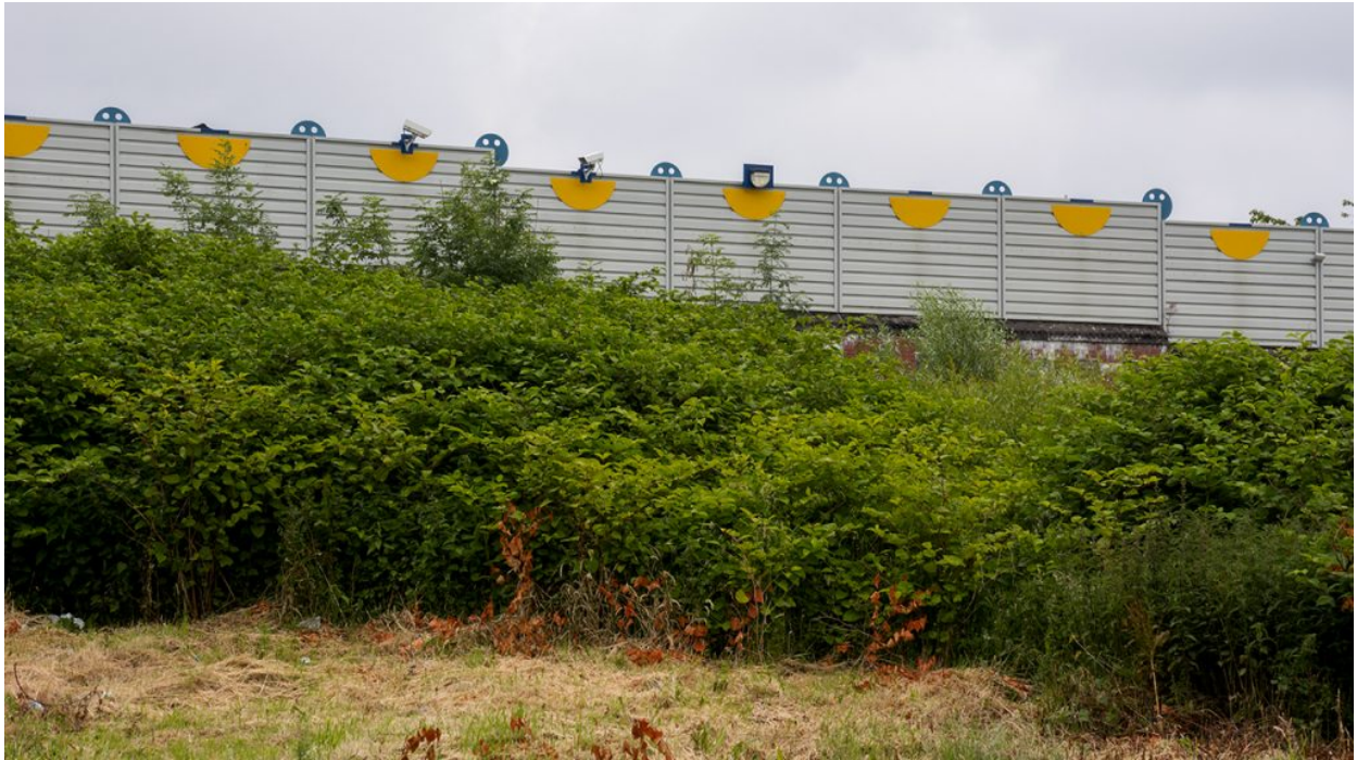
Mur a Springfield Rd, al sud de la ciutat, al costat nacionalista.