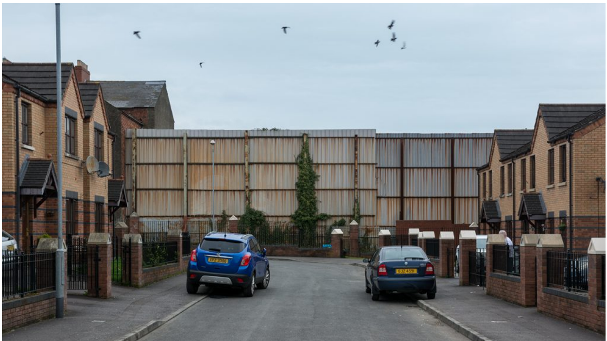
Fortfield Place, nacionalista. Darrere el mur, hi ha un carrer i darrere un altre mur, abans d'arribar a zona unionista.