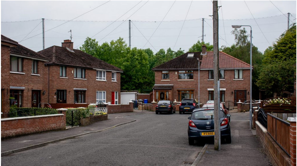
Deerpark Parade, una zona unionista de West Belfast.