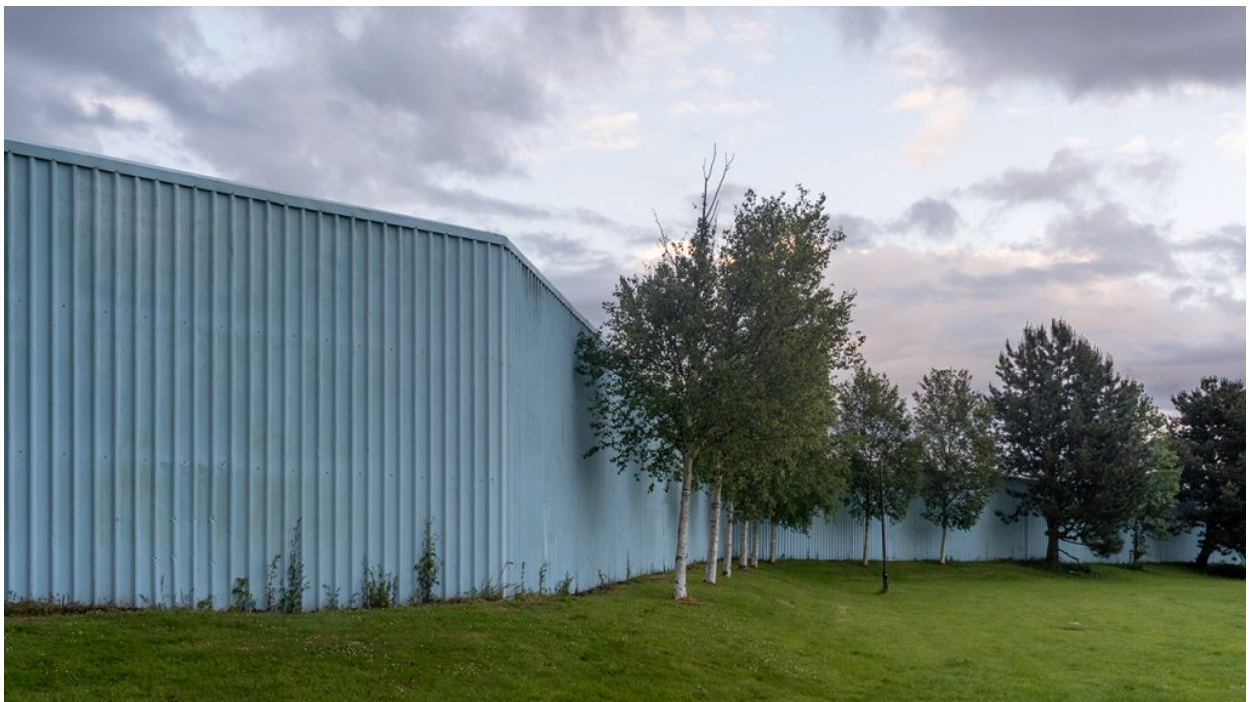
Parc dividit per la prolongació del mur que separa els unionistes d'Oldpark dels nacionalistes de Cliftonville.