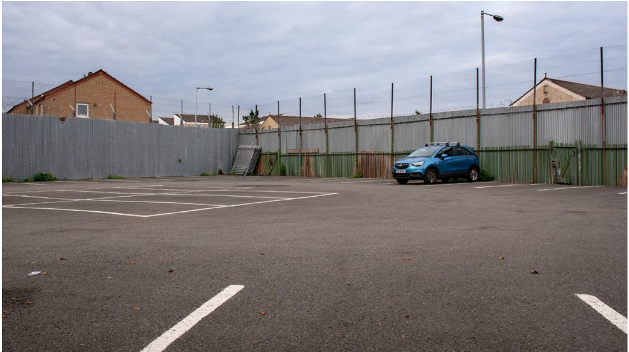
Pàrquings del Royal Victoria Hospital. A l'altra costat de la tanca, la part nacionalista de Roden St.