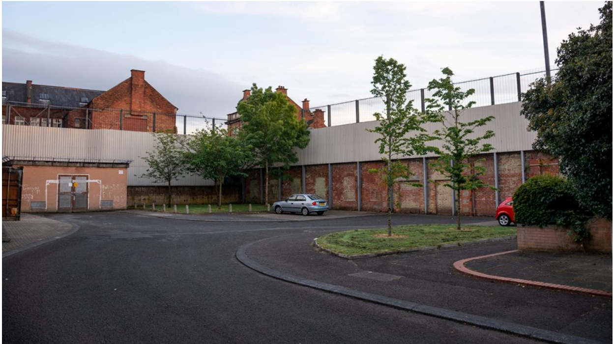
Clandeboye Gardens, zona nacionalista al nord banda nord de Cluan Place.