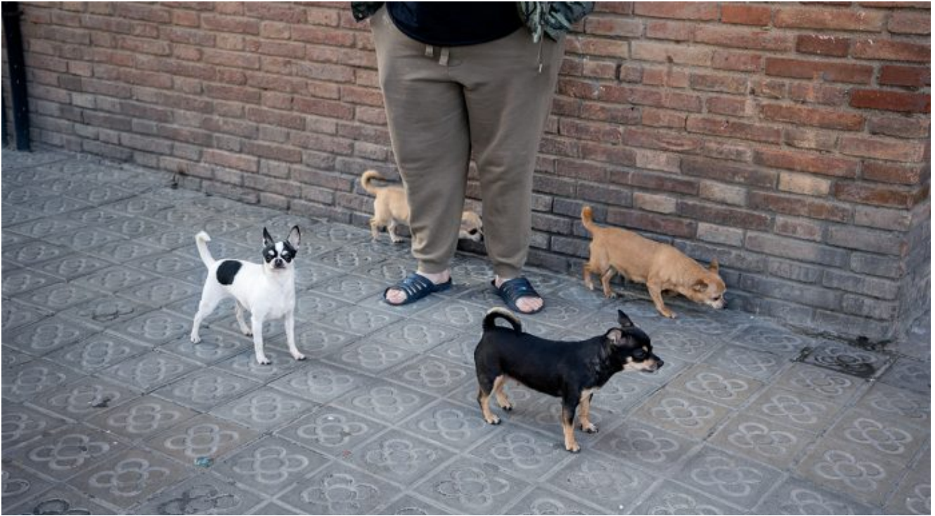
La Barceloneta. 14 d'abril.