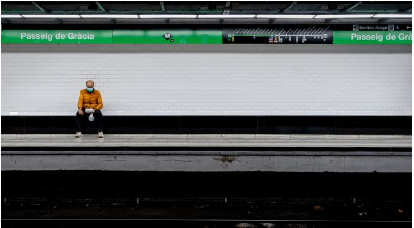
Metro Passeig de Gràcia 29 de març.