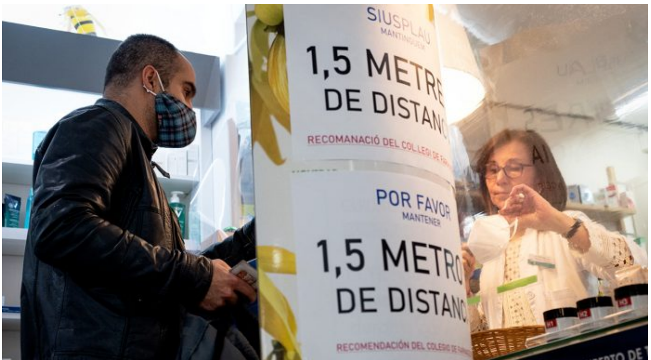
Farmàcia Les Carolines, a Gràcia. 7 d'abril.