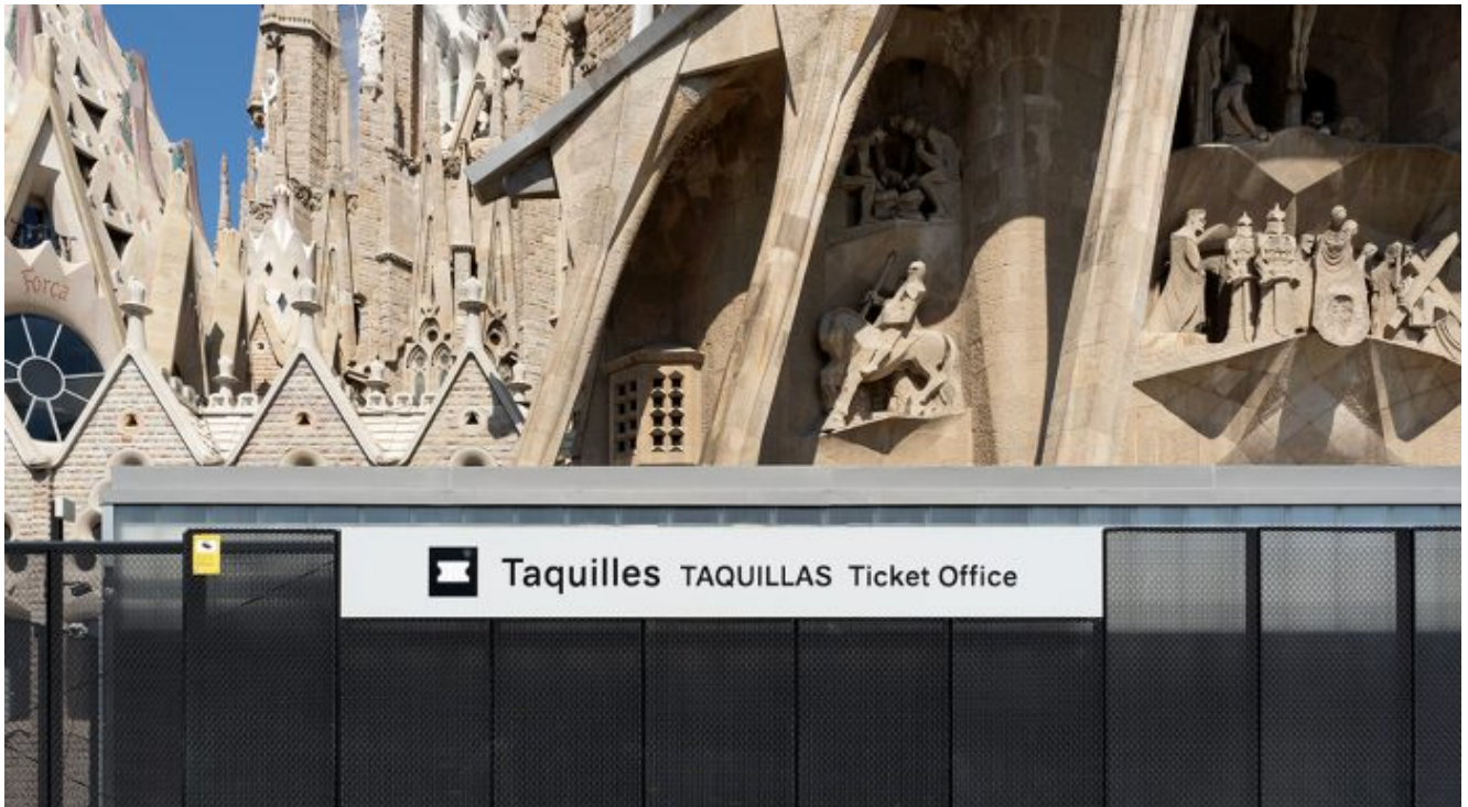
Sagrada Família per Setmana Santa. 10 d'abril.