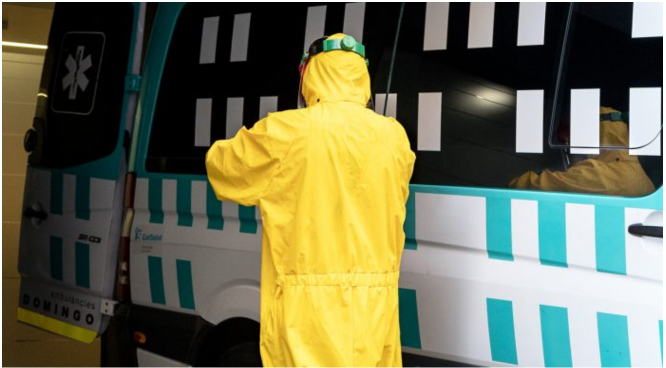
Tècnic vestit amb EPI per sobre d'una samarreta de Cristiano, a l'Hospital Fremap, a Sant Gervasi. 6 d'abril.