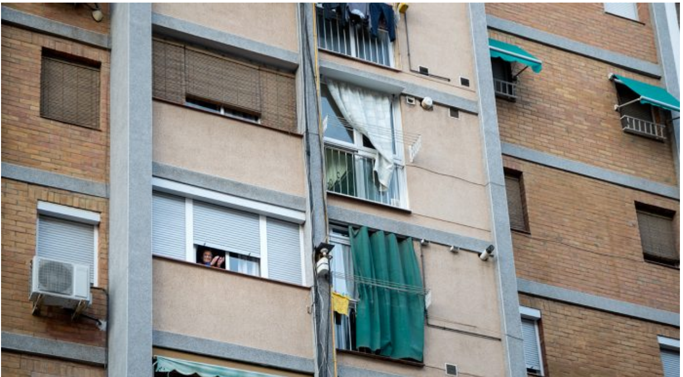
:00 h, a St. Ildefons, Cornellà. 9 d'abril.