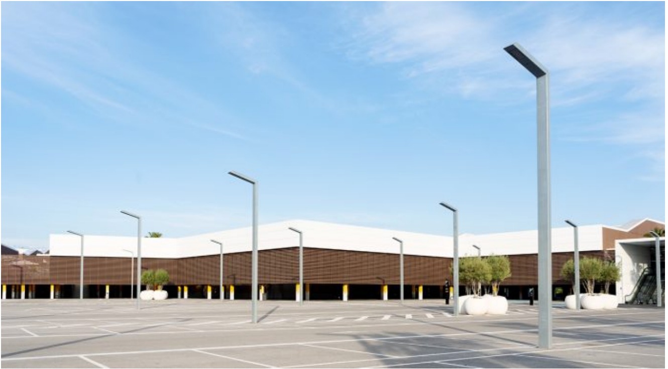
Pàrquing de Viladecans Style Outlets, en horari comercial. 6 d'abril.