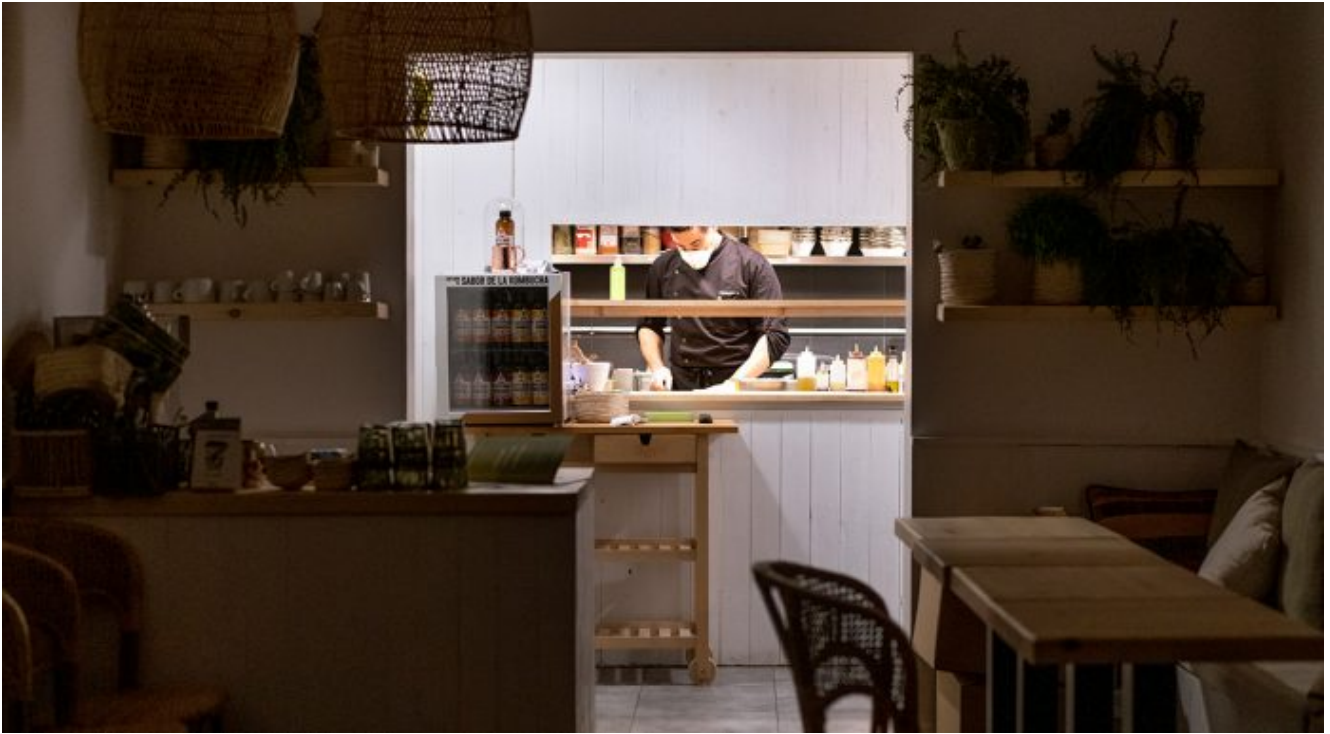
L'Avocaterie, a Gràcia, tancat però amb la cuina treballant per comandes. 29 de març.