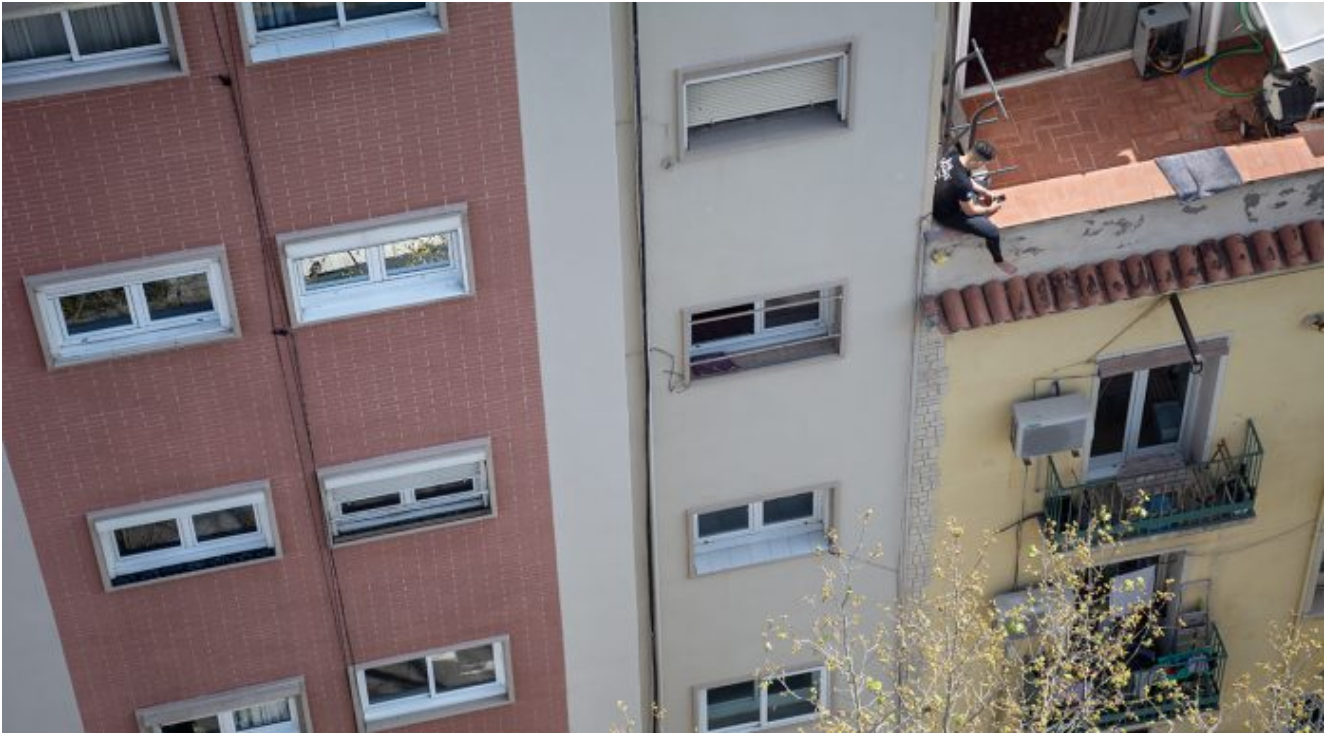
Poblenou. 19 de març.