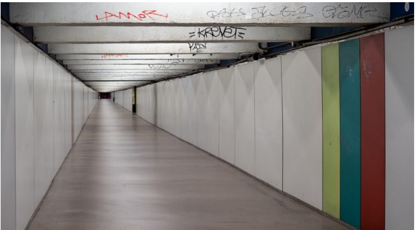
Enllaç metro Passeig de Gràcia. 29 de març.