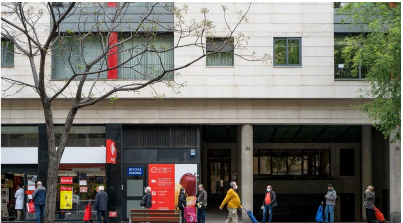
Eroski al carrer Berlín. 11 d'abril.