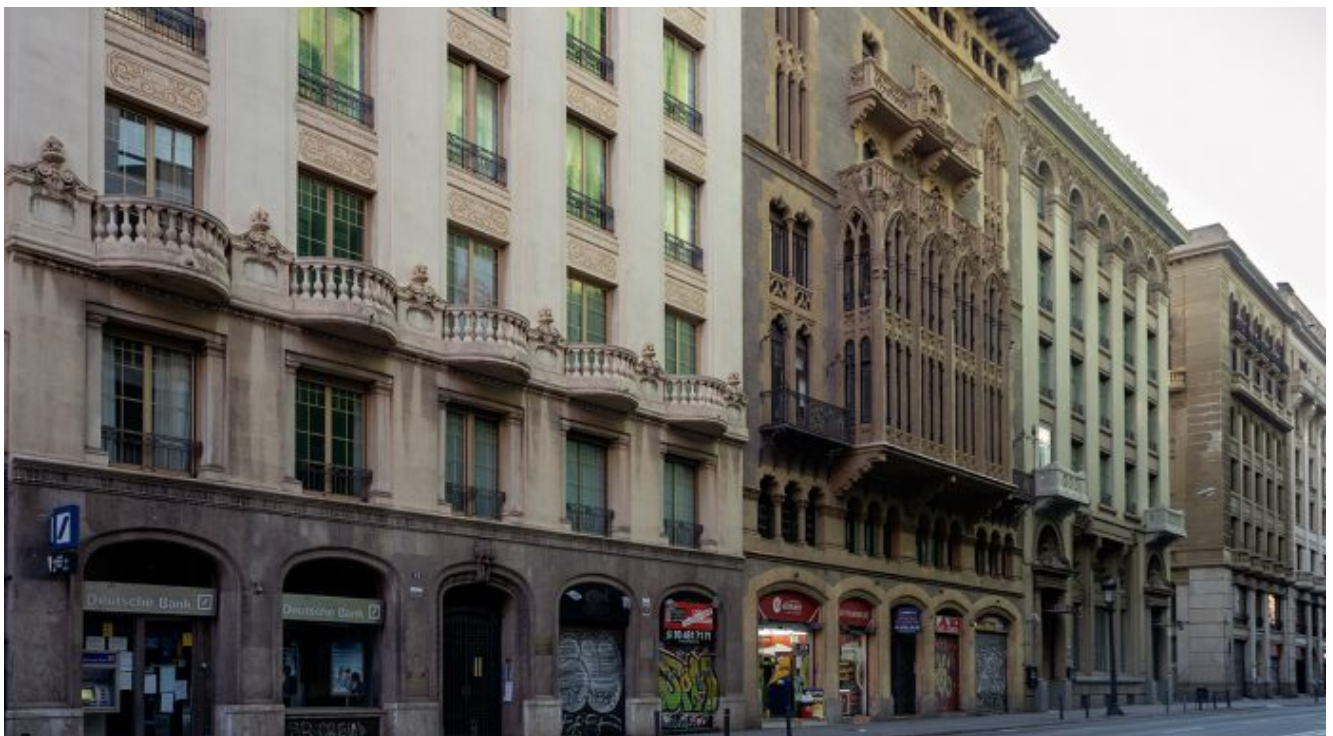
Via Laietana. 14 d'abril.