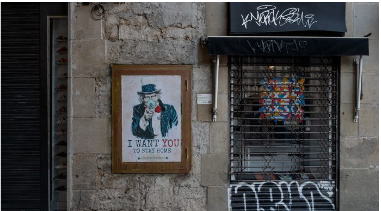
Plaça Sant Jaume. 14 d'abril.