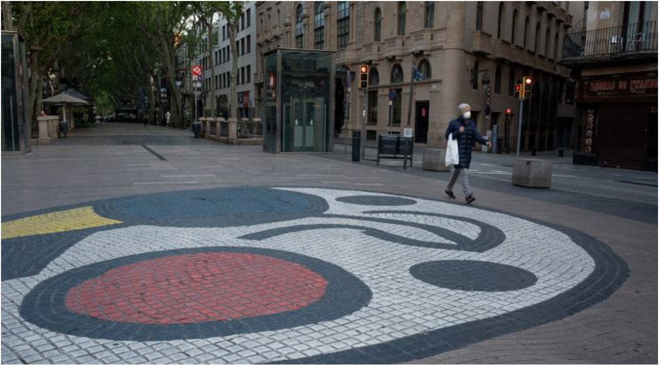
Les Rambles. 14 d'abril.