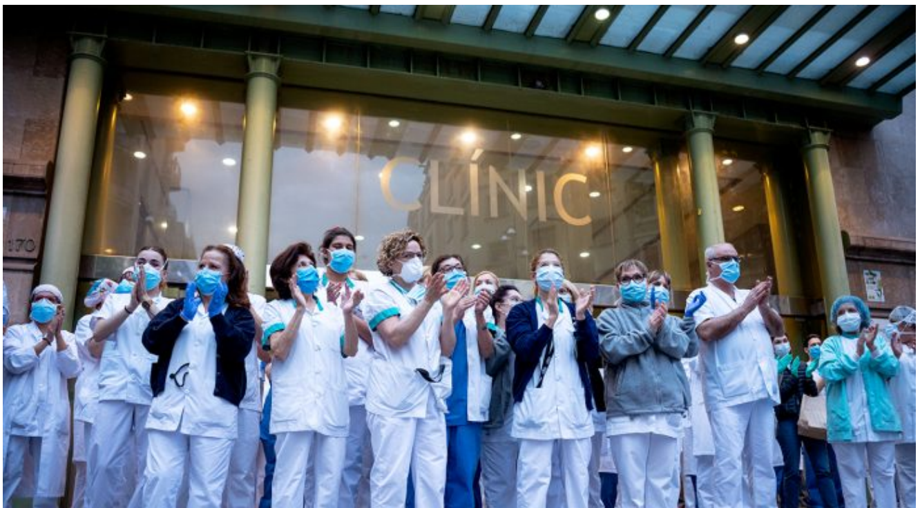
Hospital Clínic. 7 d'abril.