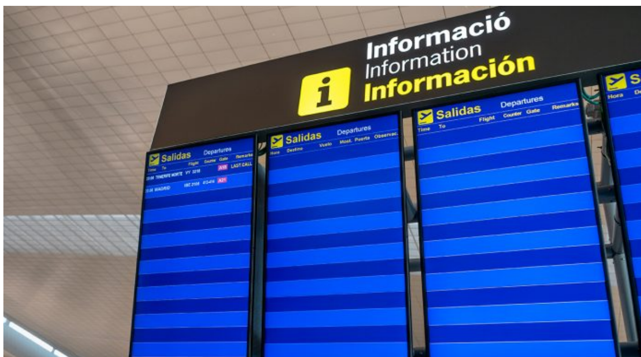
Aeroport del Prat. 6 d'abril.

El 15 de març es va decretar l'estat d'alarma i d'aleshores ençà les mascaretes i els espais buits han esdevingut quotidians. Les excepcions que contempnen les mesures de confinament dibuixen nous paisatges urbans: el groc de les ambulàncies, les cues amb distància de seguretat als supermercats, la vida a balcons i terrats, gent passejant el gos per tot arreu. Malgrat que dimecres vam saber que un nou recompte amb les dades de les funeràries feia pujar la xifra de morts un 84% (1 de cada 1000 catalans ha mort per Covid-19), l'evolució de la corba de mortalitat convida a un optimisme contret, i més d'hora que tard minvaran les restriccions. Tanmateix, passarà temps abans que les coses tornin a ser com eren, si és que mai tornen a ser-ho del tot.