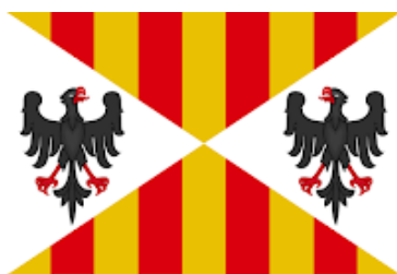
Escut Regne Aragonès de Sicília

En uns moments històrics com els actuals, amb presos polítics catalans a presons espanyoles, en els quals Catalunya necessita suport per la seva qüestió nacional i política a Europa i al món, donar a conèixer fets històrics com aquesta presència dels quatre pals a la catedral d'Aarhus és un factor importantíssim. Les afinitats històriques en els temps passats poden comportar simpaties i connexions polítiques en els temps presents.