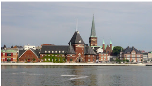
Aarhus i catedral

Aquest estiu he fet un creuer pel Mar Bàltic. Vaig sortir des del port de Copenhaguen per anar a la ciutat d'Aarhus on teníem la primera aturada. En el port d'Aarhus, des de dalt del vaixell, es contemplava una bonica vista del poble amb la seva punxeguda catedral.