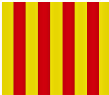
Escut de Catalunya.