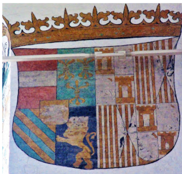
Fresc de la catedral d'Aarhus a Dinamarca

A les parets té pintats frescos de gran valor artístic; té l'òrgan més gran de Dinamarca; el seu tríptic és el més gran tresor medieval del país. El retaule, construït en la dècada de 1470, obra de Bernt Notke, és d'alta qualitat artística. A la cripta hi ha diverses làpides relacionades amb personatges històrics, obra de l'escultor flamenc Thomas Quellinius. Mentre observava tot plegat com a turista interessat per la cultura, caminant per l'interior del temple, vaig quedar molt sorprès en veure aquest escut en un dels frescos de la paret de la catedral.