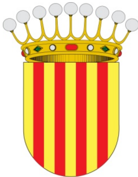
Escut dels Comtes de Barcelona amb les nou esferes a la corona 1

Governaren els comtats catalans i més tard la corona d'Aragó del segle IX fins al segle XV, uns 700 anys, en concret fins al 1410, quan morí l'últim descendent legítim de la família: Martí l'Humà (1356-1410).