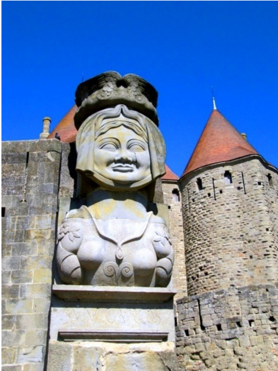
Dama Carcàs. Llegendada relacionada amb Carcassona.

Aquest comte, Bel·ló de Carcassona, era avi de Guifré el Bel·lós (840-897) comte de Barcelona –mal anomenat “El Pelós” potser amb intenció adulteradora per esborrar les arrels occitanes de la Història del noble Casal de Barcelona així com la seva concepció cultural– i pare de Sunyfred I d’Urgell (805-848) i de Sunyer I d’Empúries i del Rosselló (?-848).