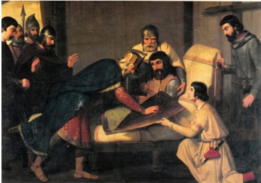
La mort de Guifré I, comte de Barcelona i l'escut dels quatre pals vermells sobre fons groc. Claudi Lorenzale Sugranyes. Escola natzarenista de Barcelona.