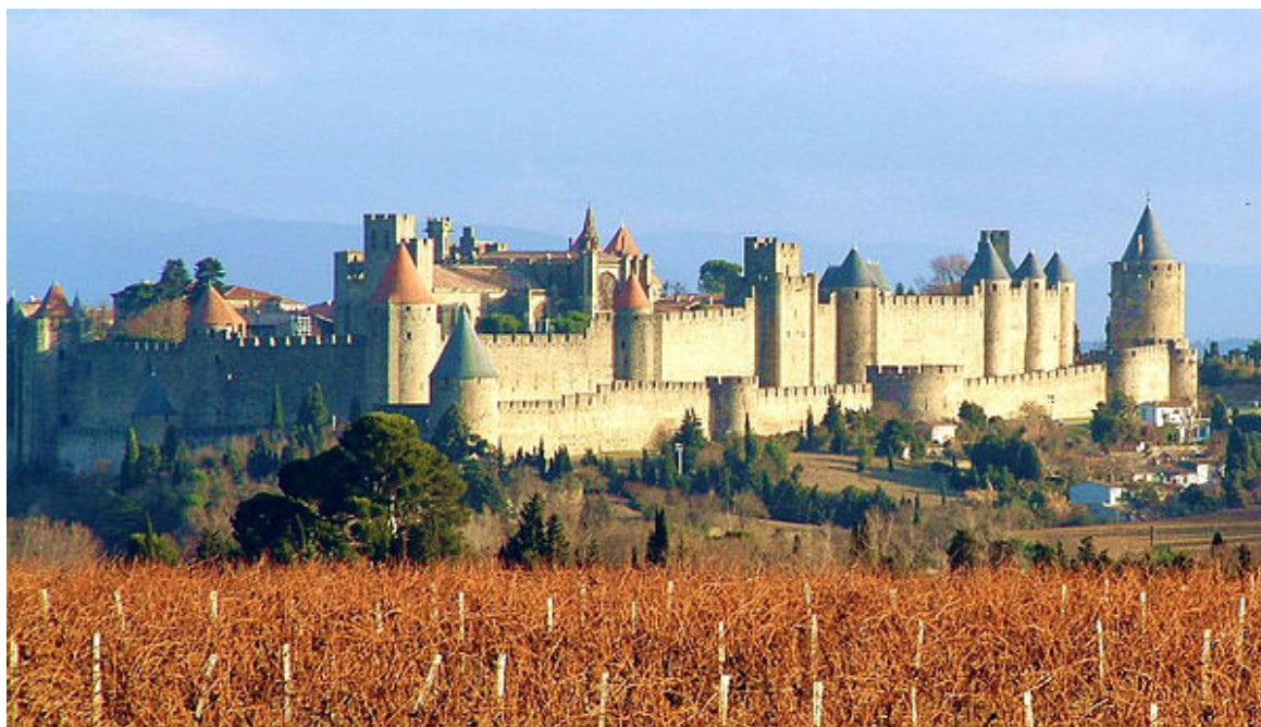
Ciutat de Carcassona (Occitània. França)

Els Bel·lònides foren una dinastia d'origen occità, malgrat que a les enciclopèdies acostuma a posar "d'origen franc" i molta gent es confon pensant que això vol dir "francès" o de langue d'oïl i no és així, ja que eren el que avui se'n diu occitans i de llengua d'oc, i descendents del comte Bel·ló de Carcassona (?-810).