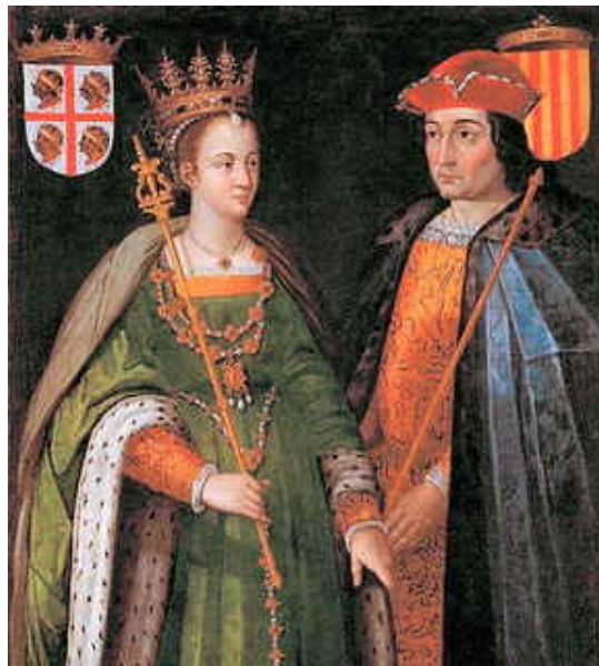
Peronella reina d'Aragó i Ramon Berenguer IV comte de Barcelona. Museu del Prado 2

La Corona d'Aragó fou el conjunt de territoris que estigueren sota la jurisdicció del rei d'Aragó. El seu naixement és fruit de la unió dinàstica sorgida pel matrimoni entre el comte de Barcelona Ramon Berenguer IV i la reina Peronella d'Aragó, el 1137.