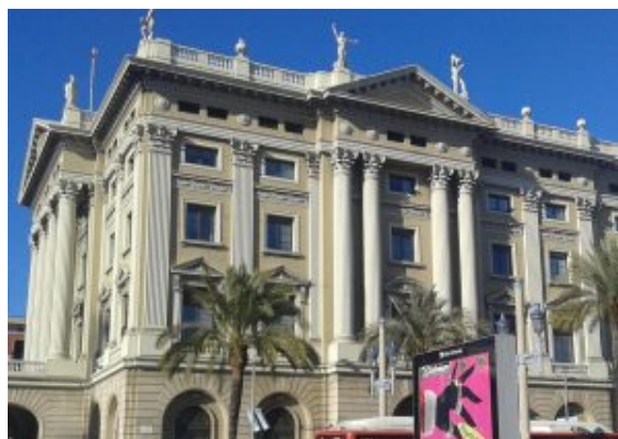
Edifici del Govern Militar

Tant a l'interior com a l'exterior de l'edifici del Govern Militar hi oneja, únicament, la bandera espanyola. En canvi, al Parlament de Catalunya, al Palau de la Generalitat, etc., hi onegen, en compliment de les lleis, l'espanyola i la de les quatre barres. La bandera espanyola, com a única insígnia dels edificis, converteix aquests, ni que sigui simbòlicament, en entitats amb un estatus extraterritorial; això és, en "ambaixades", "consolats" i "bases militars", que són tractats pel país receptor com a part del país d'on procedeixen.