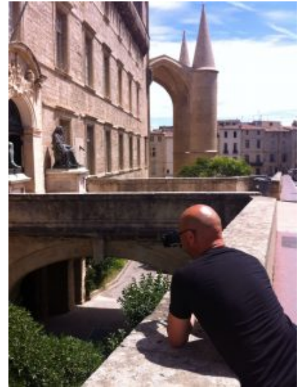
Facultat de Medicina de Montpellier.